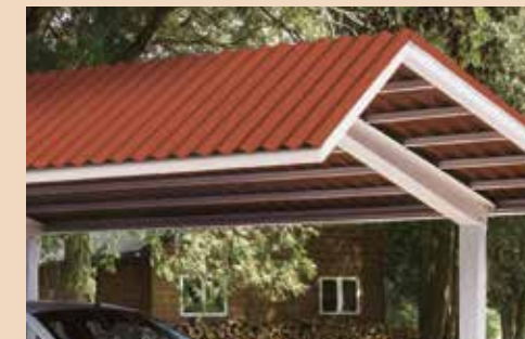
Tamaños estándar: 26" de ancho - 8', 12'