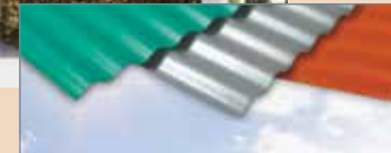
Verde bosque tropical Gris castillo Rojo ladrillo