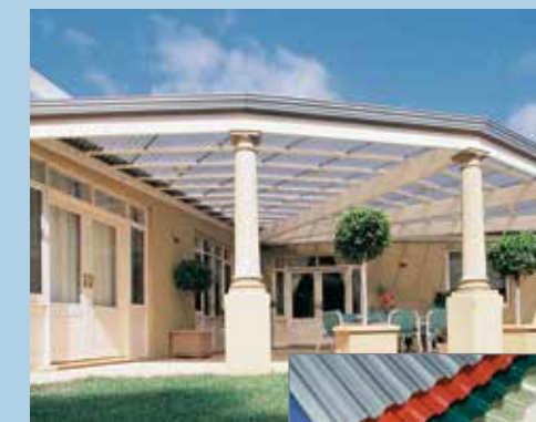
Tamaños estándar: 26" de ancho - 6', 8', 10' y 12' 49.6" de ancho - 8', 12' y 16'